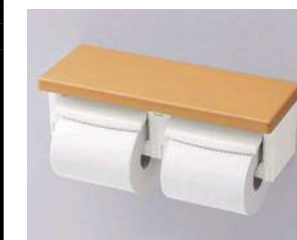
棚付紙巻器 YH600FM #