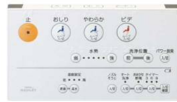
ウォッシュレット用リモコン