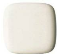
#SC1 パステルアイボリー